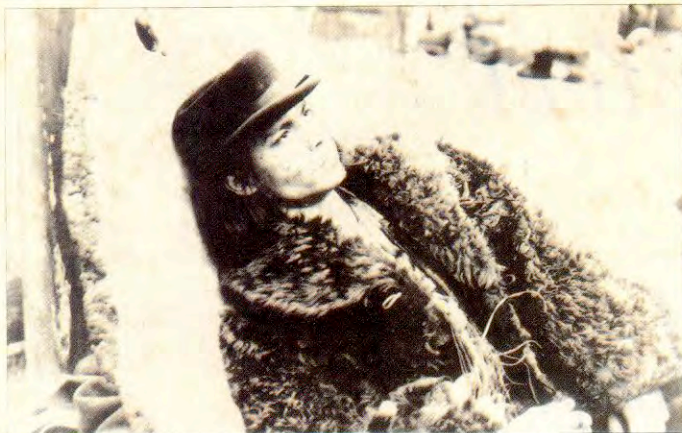
Deep: anti-herói em viagem alucinatória pelo Velho Oeste