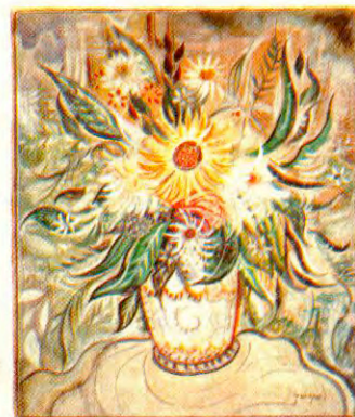
Guignard: lírico e moderno