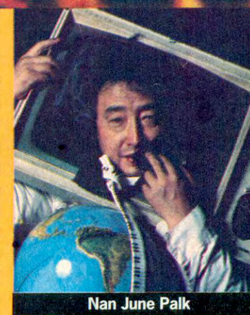
Nan June Paik

em uma maratona de 12 horas diárias de eventos um mix de espetáculos, palestras, seminários e exposições. Todas as tendências do futuro